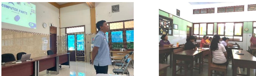
Gambar 6 dan 7. Praktek Micro Teaching