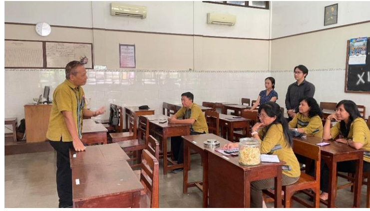
Gambar 3 dan 4. Kegiatan Role Play

Pada pertemuan keempat, para guru mempelajari instruksi untuk memberikan umpan balik atau feedback . Pemberian umpan balik kepada siswa ditujukan supaya siswa dapat meningkatkan dan memperbaiki hasil belajar mereka sehingga siswa dapat mencapai tujuan pembelajaran yang telah ditetapkan pada awal pembelajaran (Komara et al., 2024). Selain itu, umpan balik diberikan dengan tujuan untuk memotivasi dan meningkatkan pencapaian siswa. Ungkapan umpan balik seperti “ Well done! ”, “ You have done a great job! ”, “ Your writing is good, but you need to improve.... ”, “ You are on the right track! ”, “ To make it even better, you could ... ” Skenario role play yang digunakan pada pertemuan ini dapat dilihat pada Gambar 5.